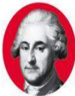
Stanisław August Poniatowski Król Polski