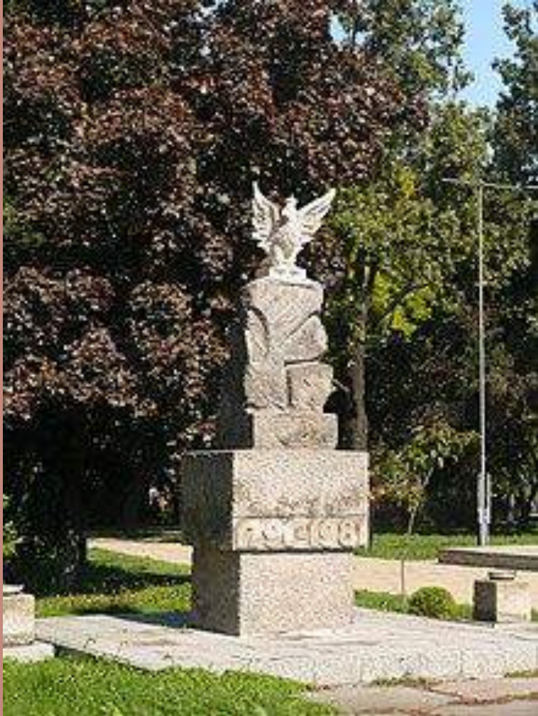
Pomnik ku czci uchwalenia konstytucji