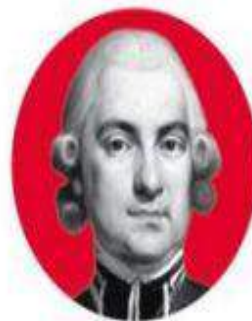
Hugo Kołłątaj Zredagował tekst Konstytucji