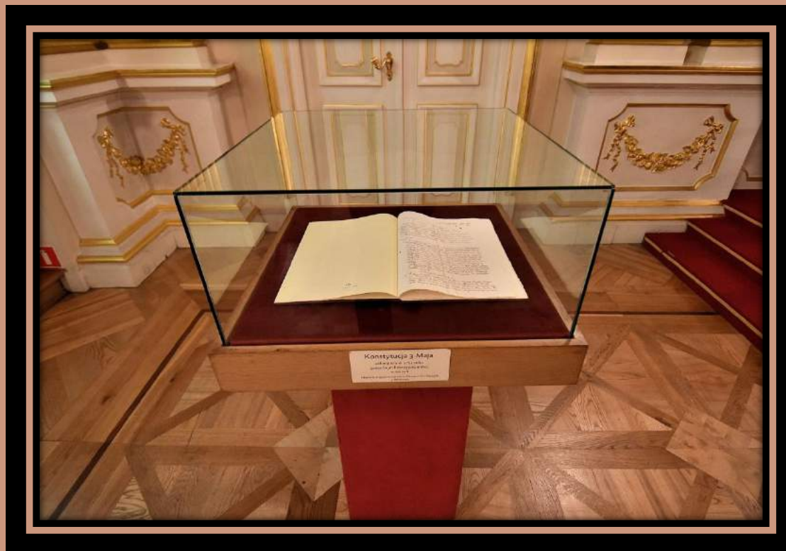
Kopia Konstytucji 3 maja eksponowana w Sali Senatorskiej Zamku Królewskiego w Warszawie