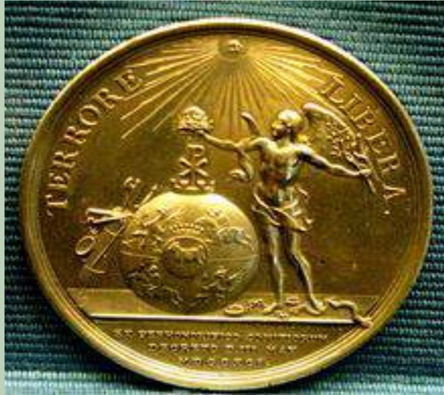
Medal wybity w 1791 z okazji uchwalenia Konstytucji 3 maja