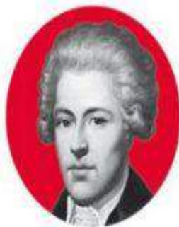
Ignacy Potocki Przywódcą opozycji